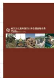
【被災文化遺産復旧に係る調査報告書】

文化遺産国際協力に対する各国の取り組み等に関する調査研究を行っています。この調査研究をもとに、日本による協力事例の企画・準備活動への支援を実施しています。2009年度には、諸外国からの保存修復等に係る支援協力要請への対応としてモンゴル国において文化遺産国際協力の調整支援を行いました。また、ブータンに対する協力相手国調査を実施し、協力可能性のある分野とニーズ把握を行いました。その他にも、被災文化遺産復旧に係る調査を実施し、中国、タイ、インドネシア、イラン、ギリシアの被災例を通して、各国の文化遺産の防災体制と取り組みや国際支援動向について報告書をまとめました。