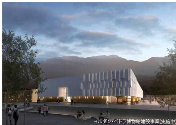
ヨルダン・ペトラ博物館建設事業(実施中)